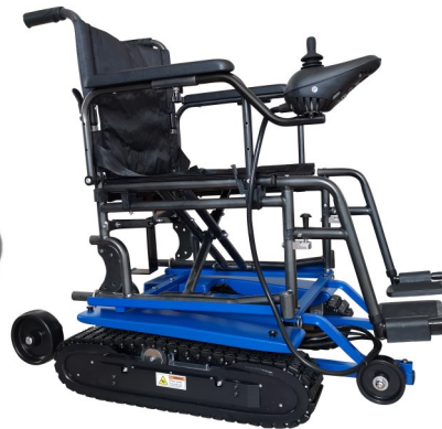
FT 2 mit integriertem Sitz